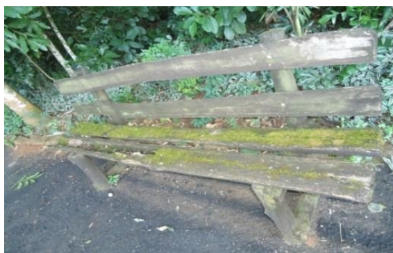
Figuras 3 e 4 - Parque Jacarandá: bancos e placas de orientação em más condições.

de um parque, sendo necessário que haja as devidas manutenções. Outros equipamentos, no entanto, apresentam irregularidades para uso, pois necessitam de sérias manutenções ou então devem ser trocados por novos. São exemplos as placas de orientação que apresentam pouca visibilidade. Em bom estado proporcionariam informações pertinentes de animais e da arborização e serviriam de guia aos usuários. Sobre a lanchonete que se encontra desativada, o seu funcionamento seria de grande contribuição para a permanência da população, posto que configuraria em um lugar de descanso, recreação e encontros. As figuras 3 a 6 demonstram aspectos do Parque Jacarandá.