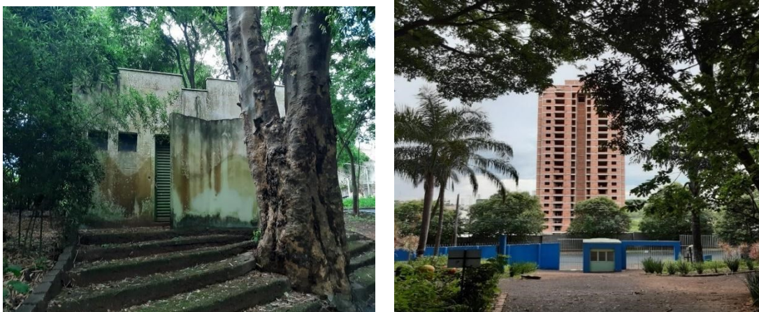
Figuras 5 e 6 - Parque Jacarandá: Acesso a banheiro e vista parcial da entrada do recinto.