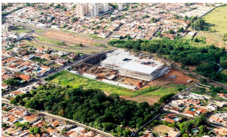
Figura 2 - Parque Jacarandá, em primeiro plano.